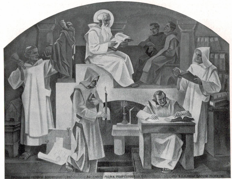
Das Wirken der Mönche des hl. Benedikt